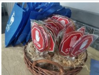
Międzynarodowy Dzień Bez Przemocy