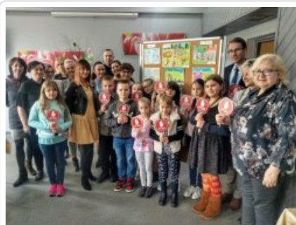
Międzynarodowy Dzień Bez Przemocy