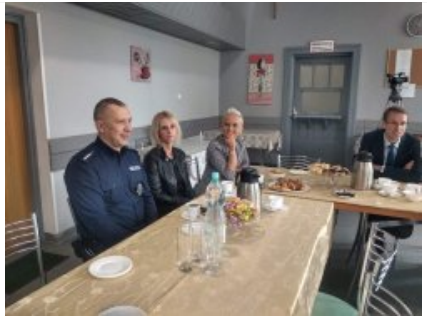
Międzynarodowy Dzień Bez Przemocy