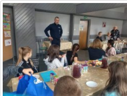
Międzynarodowy Dzień Bez Przemocy