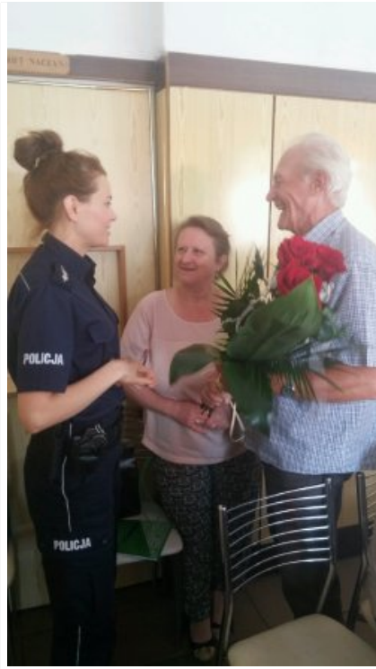
Profilaktyka na spotkaniu z seniorami