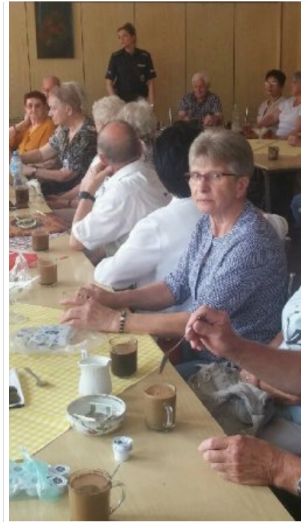
Profilaktyka na spotkaniu z seniorami