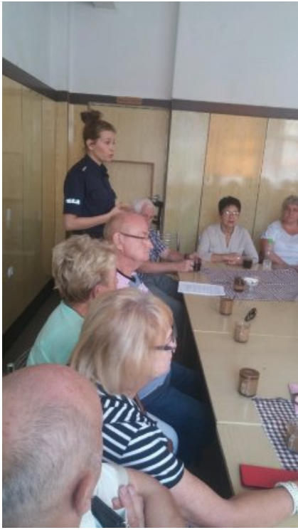
Profilaktyka na spotkaniu z seniorami